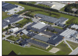
M.P. Koefoeds Vej 10