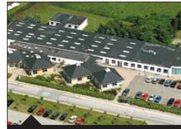
Jørgen H. Jensens Vej 3