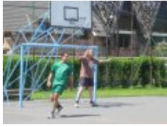
Fodboldkamp mellem „Ungarn“ og „Danmark/Tyskland“