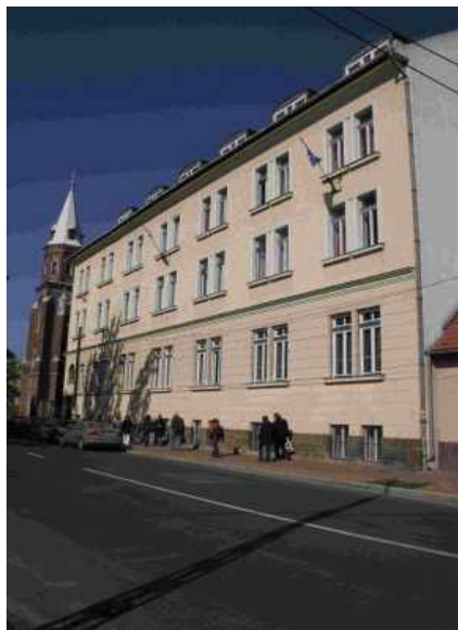
Skolen i Budapest: "Berzeviczy Gergely Közgazdasági és Külkereske delmi Szakközépiskola és Gimnázium"

Under ovennævnte motto mødtes elever og lærere fra handelsgymnasiet ved EUC NORD med elever og lærere fra Berufskolleg Herne (Nordrhein Westfalen) i Budapest. Den tredje partner i vores Comenius projekt er nemlig et gymnasium i Budapest bydelen Ujpest, og det var deres tur til at arrangere det halvårige møde. Det er den nuværende HH 2 F, der hele det første år af handelsgymnasiet har deltaget i projektet. Formålet med et Comenius skoleprojekt er, at eleverne arbejder sammen med elever på partnerskolerne. Klasserne og lærerne aftaler indbyrdes hvilke temaer de vil arbejde med. Temaet for det igangværende projekt er turisme, og på mødet præsenterede og sammenlignede eleverne resultaterne af deres undersøgelser i Vendsyssel, Ruhrdistriktet og Budapest. I sammenligningen diskuteredes bl.a. de meget forskelligartede udgangspunkter for turisme i en storby, et tidligere industriområde og et regulært landområde som Vendsyssel.