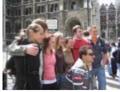
Gruppenbillede foran Parlamentet