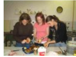
Tysk/dansk/ungarsk kartoffeskrælning til den hjemmelavede gulasch

Når unge mennesker samles, spiller det sociale samvær en vigtig rolle. Vores tur til Budapest var ingen undtagelse. De danske elever hyggede sig meget med de ungarske værter og med de tyske repræsentanter, og der blev diskuteret skole, politik, sport, musik, kammeratskab mv. Det åbnede for den faglige diskussion, når det egentlige projekt skulle diskuteres.